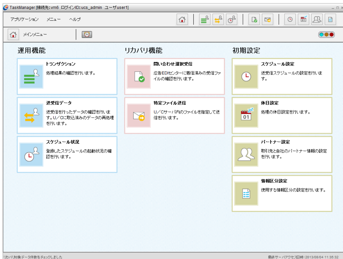
図 2-1 タスクマネージャ メニュー画面